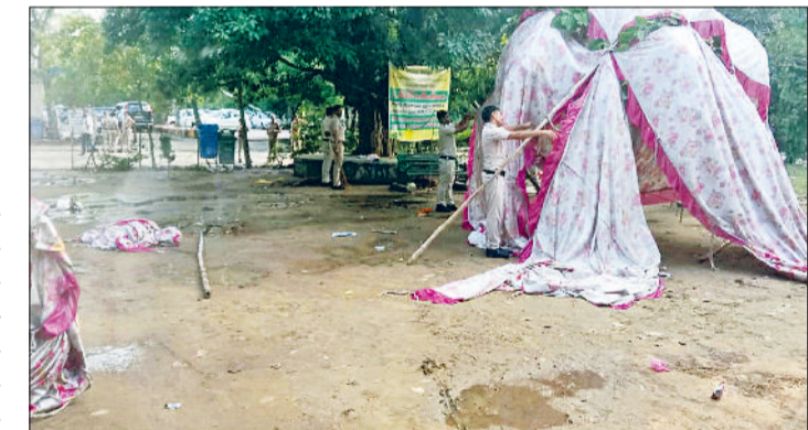
रोहतक। विजय पार्क से टैट को हटाने पुलिस प्रशासन

पंडित भगवत दयाल शर्मा स्वास्थ्य विज्ञान विश्वविद्यालय रोहतक में आउटसोर्स एजेंसी द्वारा हटाए गए कुछ कर्मचारियों के धरने के कारण आपातकालीन विभाग में आने वाले मरीजों, चिकित्सा अधीक्षक कार्यालय, नेत्र रोग विभाग की ओपीडी में आने वाले मरीजों और हॉस्टल के विद्यार्थियों को परेशानियों का सामना करना पड़ रहा था। गुरुवार को मरीजों की इन परेशानियों को देखते हुए पुलिस प्रशासन द्वारा विजय पार्क बैठे लोगों को वहां से हटाकर विजय पार्क खाली करवाया गया। जानकारी के अनुसार, आउटसोर्स एजेंसी द्वारा हटाए गए कुछ कर्मचारी पिछले 17 दिनों से विजय पार्क में अनिश्चितकालीन धरना दे रहे थे, वहां से उत्पन्न हो रहे शोर के चलते आपातकालीन विभाग में भर्ती गंधीर मरीजों,