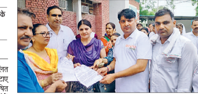
सोनीपत। लघु सचिवालय के बाहर विरोध प्रदर्शन करते हुए मंच के पदाधिकारी एवं सदस्यगण।

गांव सल्लिमसर माजरा की दलित बस्ती में स्थित शराब ठेका न हटाए जाने को लेकर दलित पिछड़ा शोषित आवाज मंच संगठन के दर्जनों सदस्यों ने आज प्रशासन के खिलाफ जोरदार विरोध प्रदर्शन किया। प्रदर्शनकारियों ने लघु सचिवालय के बाहर धरना देते हुए सिटी मजिस्ट्रेट को ज्ञापन सौंपा और ठेका हटाने की मांग दोहराई। धरने का नेतृत्व कर रहे