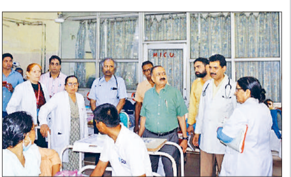
रोहतक। वार्ड 3 का औचक निरीक्षण करते निदेशक व अन्य अधिकारी।