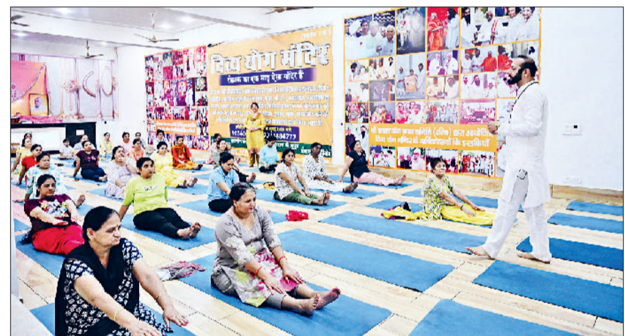
रोहतक। शिविर में साधकों को योग क्रिया करवाते योगाचार्य कार्तिकेय।