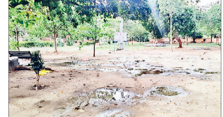
रोहतक। खाली पड़ा विजय पार्क।

नेत्र रोग विभाग की ओपीडी में आने वाले मरीज, अन्य वार्डों में भर्ती मरीजों वह हॉस्टल में रहने वाले विद्यार्थियों को भी शोर के चलते काफी परेशानियों का सामना करना पड़ रहा था। प्रशासन द्वारा कई बार उक्त लोगों को विजय पार्क खाली करने के नोटिस दिए जाने के बाद भी वहां से वे लोग नहीं हटे और वहां से उत्पन्न शोर शराबे के चलते मरीजों की देखभाल सेवाएं प्रभावित हो रही थीं। विश्वविद्यालय प्रशासन ने प्रदर्शनकारियों को धरना स्थल खाली करने का निर्देश देते हुए नोटिस जारी किया था, लेकिन हटाए गए कर्मचारी अपनी मांगों को लेकर अड़े हुए थे।