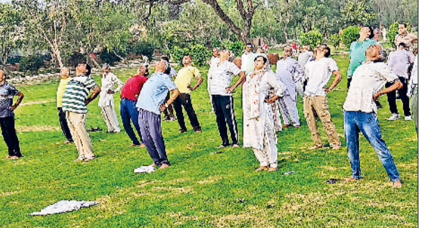
महम। शहर के टाउन पार्क में पार्टी कार्यकर्ताओं के साथ योग का अभ्यास करते राज्यसभा सांसद रामचंद्र जांगड़ा व टाउन पार्क में चल रहे निर्माण कार्य का निरीक्षण करते राज्यसभा सांसद रामचंद्र जांगड़ा।

राज्यसभा सांसद रामचंद्र जांगड़ा ने वीरवार सुबह महम हटा टाउन पार्क में भाजपा कार्यकर्ताओं के संग योग का अभ्यास किया। रामचंद्र जांगड़ा ने कहा कि योग व प्राणायाम से मनुष्य स्वस्थ रहता है। इसलिए हमें नियमित रूप से योग और प्राणायाम करना चाहिए। उन्होंने बताया कि 21 जून को अंतरराष्ट्रीय योग दिवस है। इस दिन महम के टाउन पार्क में उपमंडल स्तरीय योग समारोह आयोजित किया जाएगा। उन्होंने सभी से अंतरराष्ट्रीय योग दिवस समारोह में भाग लेने की अपील की। रामचंद्र जांगड़ा ने कहा कि भारत नरेंद्र मोदी के नेतृत्व में विश्व मित्र बन चुका है।